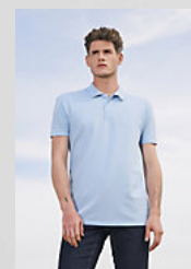
SOL'S SUMMER II 11342