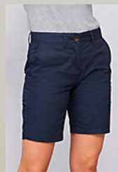
SOL'S JASPER WOMEN 02762