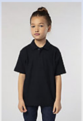
SOL'S SUMMER II KIDS 11344