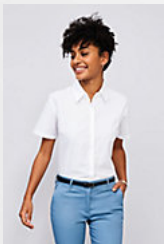
SOL'S ELITE 16030