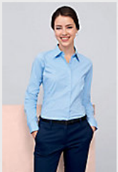
SOL'S EDEN 17015